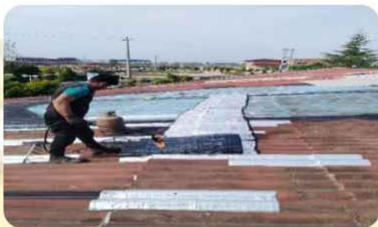
ایزوگام کردن سقف نهاد رهبری دانشگاه