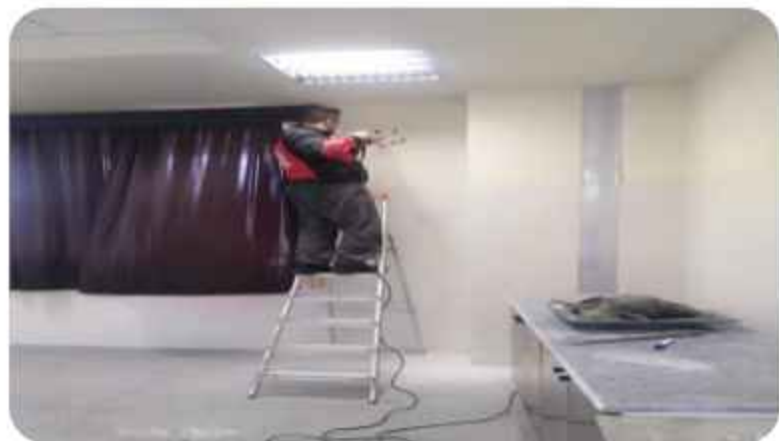
نصب کابینت و فن در آزمایشگاه جدید شیمی